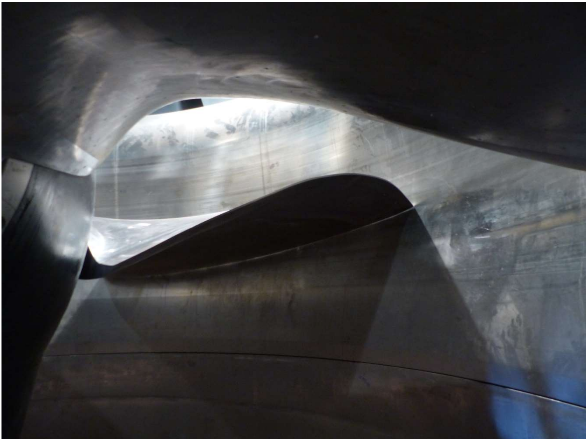
Bild: Maschinengruppe 1 Schaufel Modifikation 2021